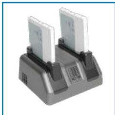
Batarya Şarj Beşiği